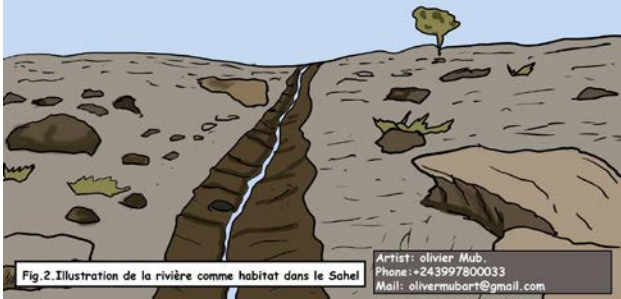
Fig.2. Illustration de la rivière comme habitat dans le Sahel

Dans le bassin du Congo (Fig.1), la population perçoit une rivière en termes de crue et étiage, l'eau est constante en saison de pluie comme en saison sèche. Cependant, dans le sahel (Fig.2), on parle du concept oued, comme l'eau est rare, un lit de sable sans eau est appelé rivière.